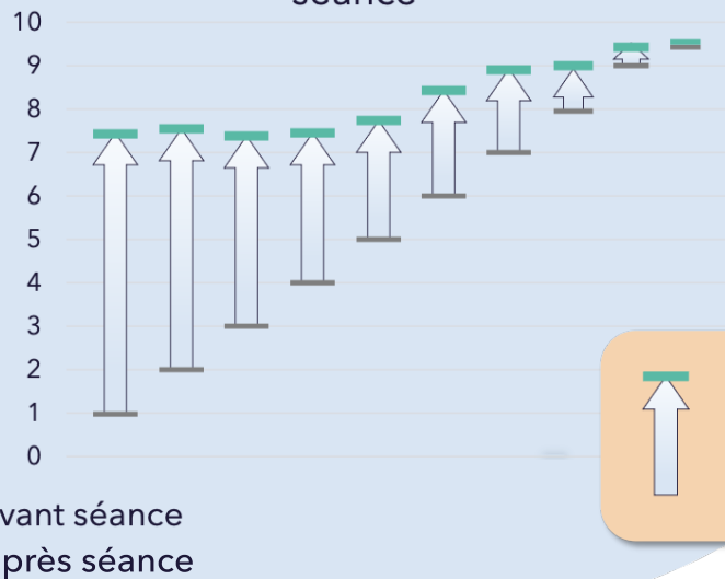
Gain moyen obtenu par séance

Plus l'utilisateur est fatigué avant séance, plus celle-ci lui est bénéfique.